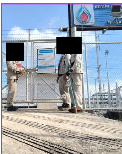
พนักงานสวมใส่ชุด PPE