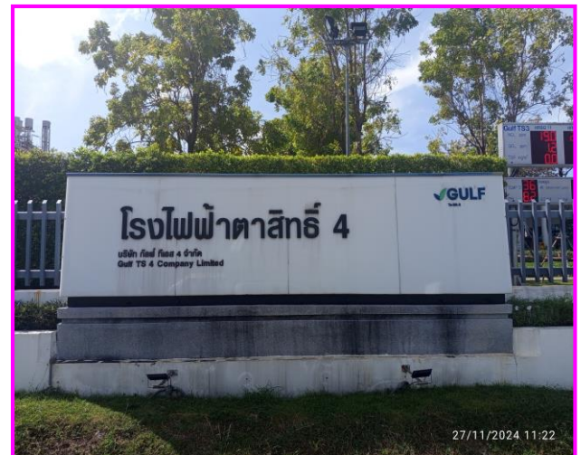
บริเวณด้านหน้าโรงงาน