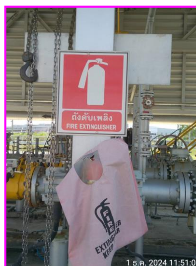
ถังดับเพลิงบริเวณท่อส่งก๊าซฯ