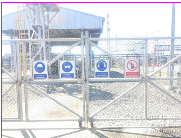
ป้ายเตือนต่างๆ บริเวณสถานีควบคุมความดันก๊าซ (MRS)