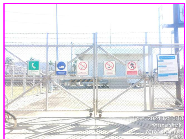
ป้ายเตือนต่างๆ บริเวณสถานีควบคุมความดันก๊าซ (MRS)