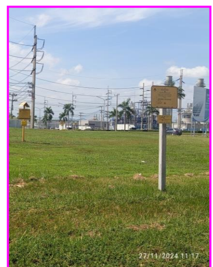
ป้ายเตือนแนวท่อส่งก๊าซฯ บริเวณโรงงาน

ภาพที่ 3.2-17 ภาพถ่ายระบบรักษาความปลอดภัยตามแนวท่อส่งก๊าซฯ และบริเวณสถานีก๊าซฯ ของโครงการท่อส่งก๊าซธรรมชาติไปยังโรงไฟฟ้าตาสี 4 โรงไฟฟ้าตาสี 3