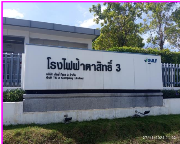
บริเวณด้านหน้าโรงงาน